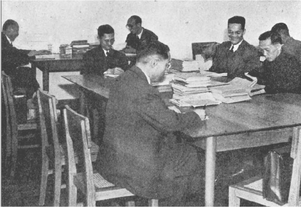
1952-1953, during recess (not facing camera)