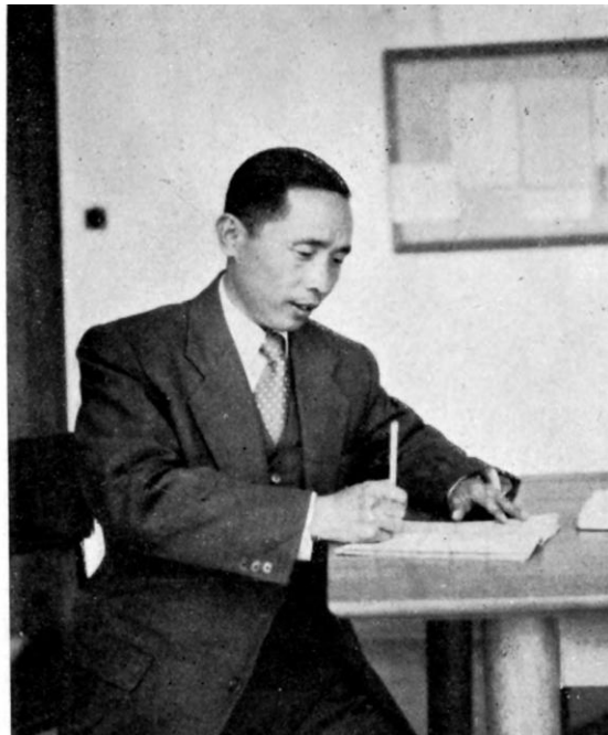
1953-1954, staff room – editing?