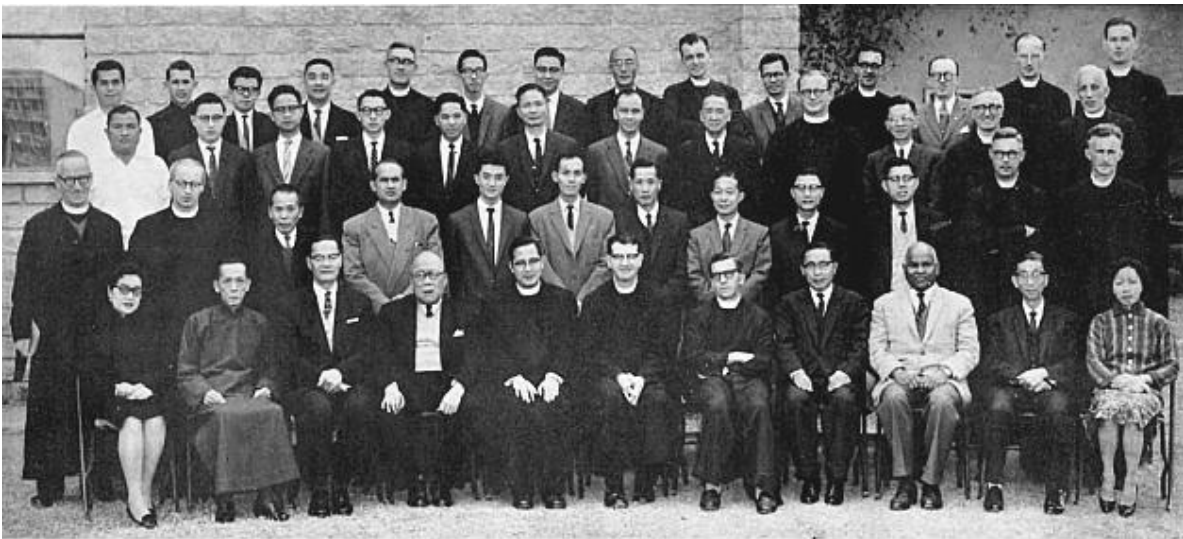
THE SCHOOL STAFF, 1960-1961

1952-1953, Staff – 3 rd row from top – 3 rd left