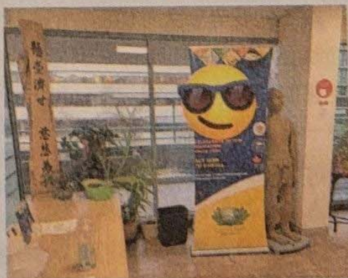
▼孔醫生任教的中醫學校。

病人服中藥反應亦正面，「(服中藥)沒西藥那麼辛苦，只要對症下藥，同樣可以很快藥到病除。」不過他坦言，中藥在加拿大的缺點是未納入醫療保險範圍，藥費需病人自付。而一劑傷風感冒藥，平均約十多元。