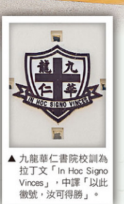
▲九龍華仁書院校訓為拉丁文「In Hoc Signo Vinces」，中譯「以此徽號，汝可得勝」。