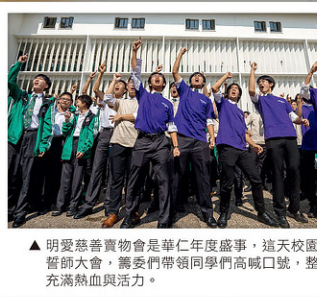
▲明愛慈善賽物會是華仁年度盛事，這天校園內舉行籌款大會，嘉賓們帶領同學們高喊口號，整個校園充滿熱血與活力。