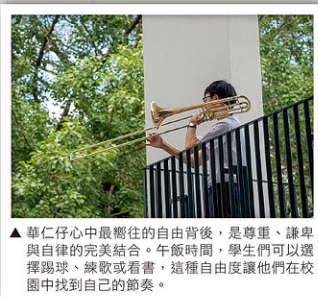
▲華仁仔心中最嚮往的自由背後，是尊重、謙卑與自律的完美結合。午飯時間，學生們可以選擇踢球、練歌或看書，這種自由度讓他們在校園中找到自己的節奏。